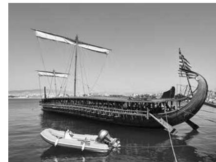
Reconstrucción de un antiguo navío mercante griego con decenas de remeros; sin duda la embarcación de Piteas tenía menos remos y era mucho más pequeña.