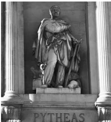
Estatua de Piteas en el Palais de la Bourse , Marsella (Auguste Ottin, 1859).

de Alejandría, en el año 48 a. C. No obstante, algunos fragmentos de su obra son citados por numerosos autores: Eratóstenes, Estrabón, Plinio, Polibio y Diódoro, entre otros.